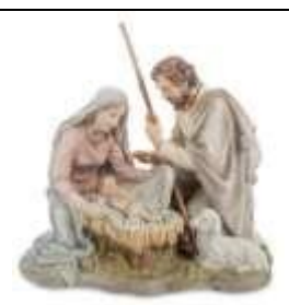
Б) Рождество Христово